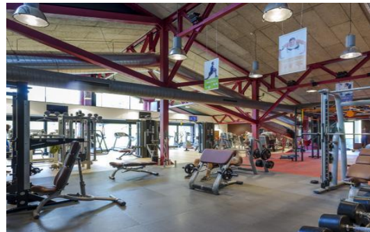
Salle de musculation