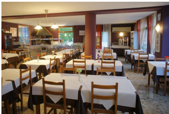
Salle de restaurant