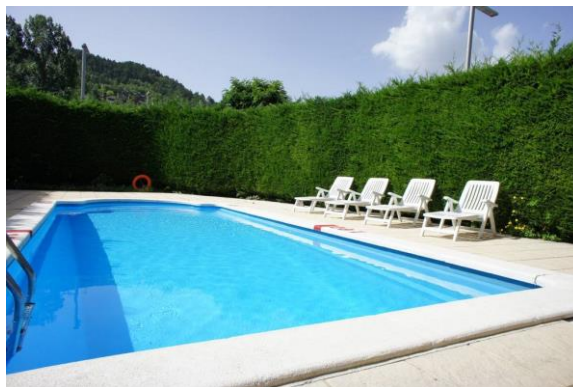
Piscine extérieure de l'hôtel